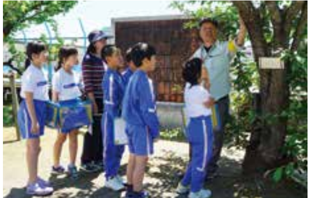
フォレストリーダー鳥さんの案内を興味深げに聞く4年生