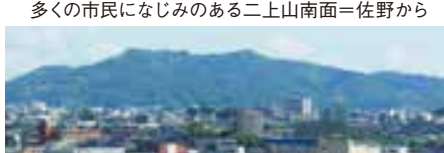
多くの市民になじみのある二上山南面=佐野から

東斜面が緩く西斜面と南斜面が急だ。西の海老坂峠付近を南南西―北北東方向に海老坂峠が、南側を南西―北東方向に石動断層が通っており、両断層を境に二上山側が隆起している。 山頂は山塊の中央部ではなく南西部に位置する。周囲には海老坂地区の高位段丘や伏木市街地の高町が位置する中位段丘などが分布している。二上山の谷は深く谷幅は狭く、その形成が新しい。東方向へはやや長く、西や南へは短い。山塊が富山湾に面する岩崎海岸や雨晴海岸は磯浜、その北は松太枝・島尾の砂浜で景勝地だ。 元は海だった。二上山中心部の地質は主に新第三紀(2300万年前〜260万年前)後期の約1000万年前に海底で堆積した鉢伏砂岩層で、その上にそれ以降で第四紀(260万年前〜現在)前期に至るまでの浅い海で堆積した砂岩層や泥岩層が分布している。周辺で貝化石が発掘されるものも少なくない。 第四紀前期ごろから砺波平野の原型を造る北東―南西方向の褶曲(波状にぼうを持ち すいかめがけて ふり下ろす)は、二上山は平野や富山湾から一気に高くなるので、下界の景色が間近に見られる。能登半島国定公園にも含まれる地形、地質や植物など見どころが多い。都市部近くの大切な自然を後世に伝えていきたいものだ。