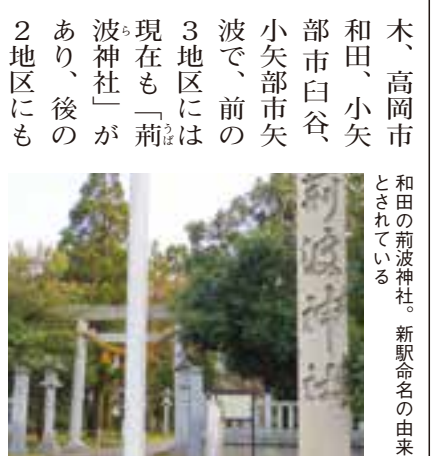
木、高岡市和田、小矢部市白谷、小矢部市矢波で、前の3地区には現在も「荊波神社」があり、後の2地区にもかつて同名の神社があったものの、今は別名に変わっている。

10世紀に完成した「延喜式神名帳」には「荊波神社」に添えた読みとして「ウハラ」または「イハラ」と書かれており、元々「やぶなみ」だったのが、後に「ウハラ」に変わったとみられる。理由はよく分かっていない。だが、そういった学術的な比定はともかく、「伝承地のひとつ」というのが新駅名の根拠という。(古くから地元では周辺をやぶなみの里と呼んでおり、「やぶなみの里」の「伝承」を伝える地のひとつとしては長い歴史がある)(市の発表文)