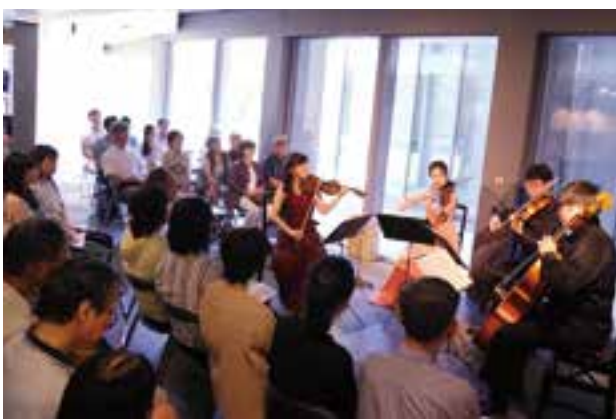
写真鑑賞と生演奏を同時に楽しむ来場者

福岡町のミュージックおカメラ館で8日(土)、「とやま室内楽フェスティバル2017 ミュージアムコンサート」が開かれた。 同コンサートは4年前に始まり、同館エントランスを会場に年4回開かれている。今回はヴァイオリン、ヴィオラ、チェロの弦楽四重奏のアルネア・カルテットがモーツァルトやスメタナの曲を演奏した。