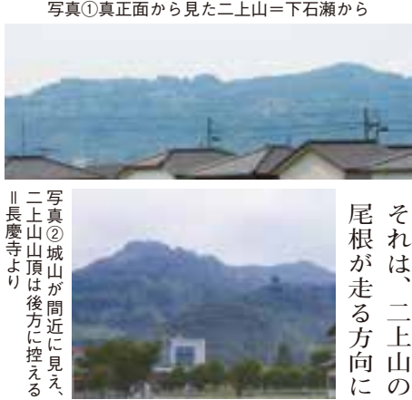
写真①真正面から見た二上山=下石瀬から 写真②城山が間近に見える、二上山山頂は後方に控える ||長慶寺より

写真①は下石瀬の庄川堤防から撮った二上山だ。二上山は真正面にそびえ、その全容を見ることが出来る。