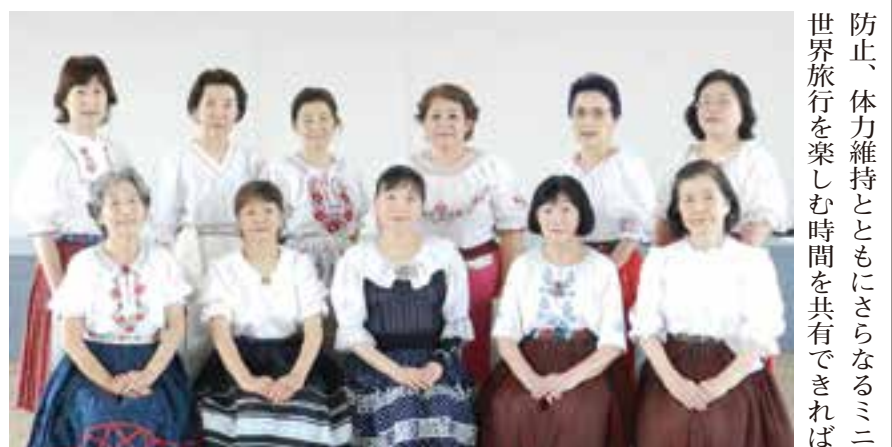
防止、体力維持とともにさらなるミニ世界旅行を楽しむ時間を共有できれば