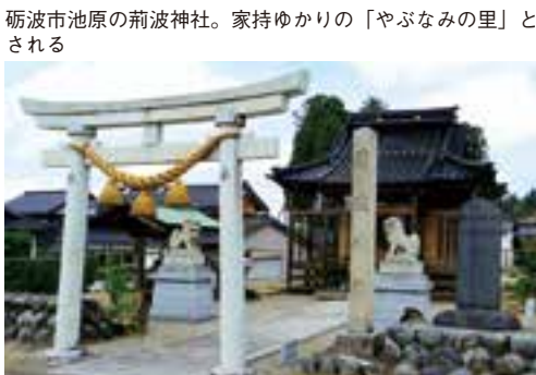
砺波市池原の荊波神社。家持ゆかりの「やぶなみの里」とされる

今の砺波市の庄川右岸には、高岡市中田地区に隣接して、当時、石粟村、伊加留岐村、井山村の荘園が北北東から南南西方向へつながって並んでいた。高岡市中田地区に隣接する一番北の「越中国砺波郡石粟村官施入田地図」(759年作成、奈良国立博物館所