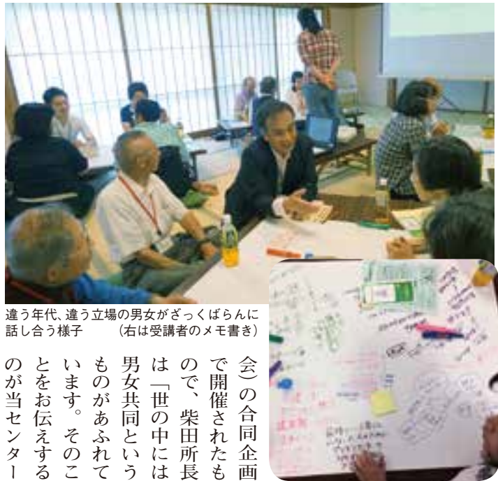
違う年代、違う立場の男女がざっくばらんに話し合う様子 (右は受講者のメモ書き)