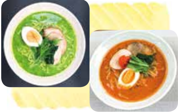
▼食で高岡を案内できる「高岡グリーンラーメン」と「高岡にんじん担々麺」

ご当地ラーメンとして人気の「高岡グリーンラーメン」と「高岡にんじん担々麺」を提供する初の直営店「緑菜軒」が、4月に小馬出町の山町ヴァレー内にオープンした。地元市民を初め、5月の御車山祭以降は県内外からの観光客も増えてきているとか。