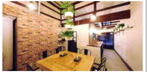
▲グループでの飲食も楽しめるカフェ風の店内