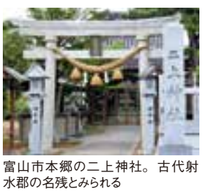
富山市本郷の二上神社。古代射水郡の名残とみられる